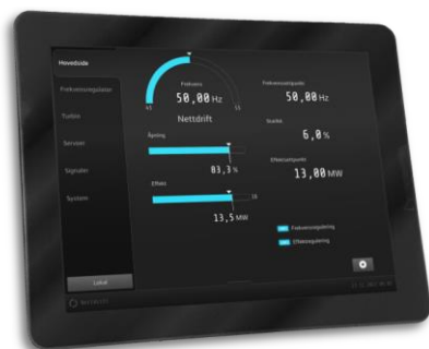
The Connexi operator interface

The controller comes with a brand new display unit with modern design and exceptional usability. The display is used for commissioning, fault diagnosis and general display of values to plant personnel.